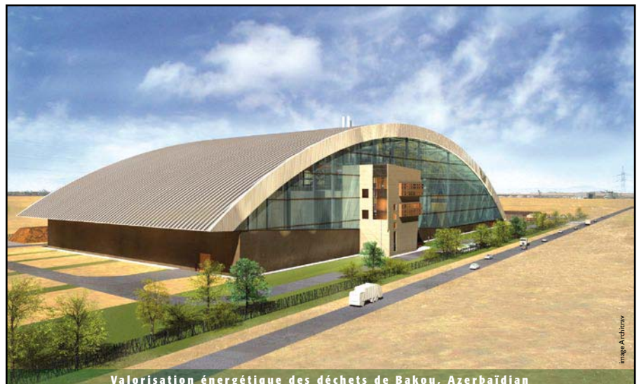
Valorisation énergétique des déchets de Bakou, Azerbaïdjan